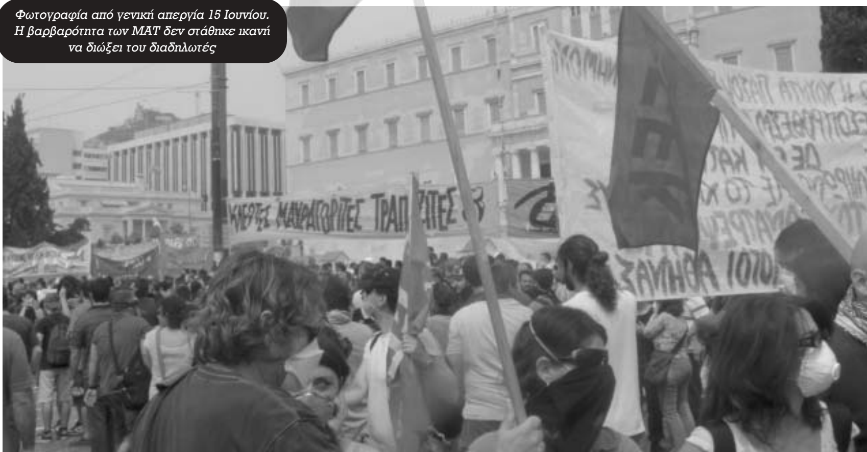
Φωτογραφία από γενική απεργία 15 Ιουνίου. Η βαρβαρότητα των ΜΑΤ δεν στάθηκε ικανή να διώξει του διαδηλωτές

καπιταλισμού, δεν είναι μόνο οι διαδικασίες διάλυσης. Είναι, κυρίως, η κρίση ως αντιφατική διαδικασία μετάβασης πέραν του καπιταλισμού.