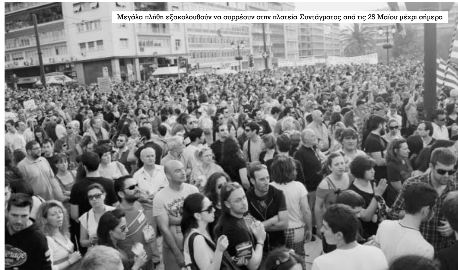
Μεγάλα πλήθη εξακολουθούν να συρρέουν στην πλατεία Συντάγματος από τις 25 Μαΐου μέχρι σήμερα

Ποια είναι τα γνωρίσματα μιας επαναστατικής κατάστασης από τη σκοπιά του επαναστατικού μαρξισμού; Όπως ο Λένιν τα συνόψισε είναι τα παρακάτω: 1) Η αδυναμία των κυρίαρχων τάξεων να διατηρήσουν σε αναλλοίωτη μορφή την κυριαρχία τους· 2) μια είτε η άλλη κρίση των «κορυφών», η κρίση της πολιτικής της κυρίαρχης τάξης που δημιουργεί ρωγμή, απ' όπου εισχωρεί η δυσσαρέσκεια και ο αναβρασμός των καταπιεσμένων τάξεων. Συνήθως, για να ξεσπάσει η επανάσταση δεν είναι αρκετό «τα κάτω στρώματα να μην θέλουν», μια χρειάζεται ακόμη και «οι κορυφές να μην μπορούν» να ηγηθούν όπως παλιά. 2) Επιδείνωση, μεγαλύτερη από τη συνθησιμένη,