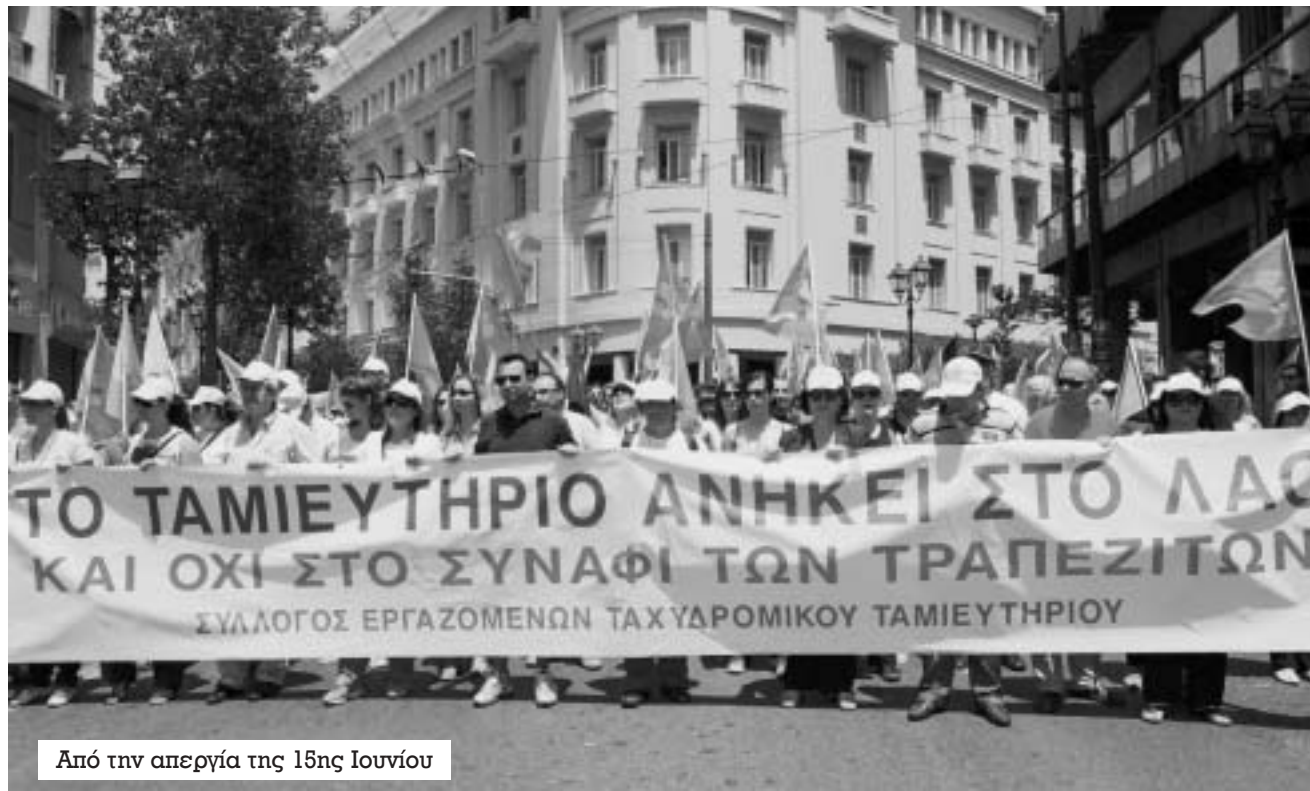
Από την απεργία της 15ης Ιουνίου

Ναι, μαζί με τον Μαρξ μπορούμε να περιγελάσουμε τις γελοιογραφικές αναουσιώσεις της ιστορίας. Και μαζί του να διακηρύξουμε πως: «Η κοινωνική επανάσταση [...] δεν μπορεί να αντιλήσει την ποίση της από το παρελθόν, αλλά μόνο από το μέλλον. Δεν μπορεί ν' αρχίσει με τον ίδιο τον εαυτό της προτού σβήσει όλες τις προλήψεις σχετικά με το παρελθόν. Οι προηγούμενες επαναστάσεις είχαν ανάγκη από κοσμοϊστορικές αναμνήσεις για να κριθύν από τον εαυτό τους το περιεχόμενό τους. Για να φτάσει στο δικό της περιεχόμενο η επανάσταση [...] πρέπει να αφήσει τους πεθαμένους να θάψουν τους νεκρούς τους. Εκεί η φράση