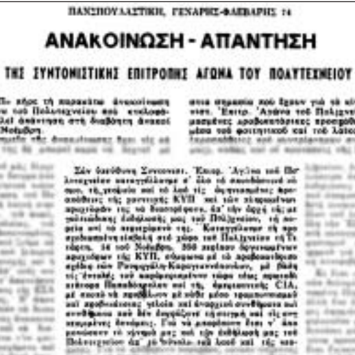
Η «υπεύθυνη» Συντονιστική Επιτροπή του ΚΚΕ, καταγγέλλει την κατάληψη του Πολυτεχνείου ως έργο προβοκατόρων. Τα μέλη τους ψηφίζουν κατά της κατάληψης.