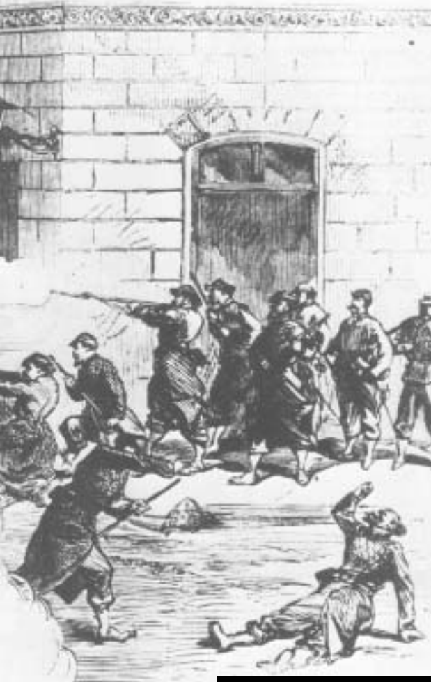
Μάχη κοντά στο Ελιζέο

εργάτες ή αναγνωρισμένοι εκπρόσωποι των εργατών, οι αποφάσεις της είχαν αποφασιστικά προλεταριακό χαρακτήρα. Είτε ψήφιζε μεταρρυθμίσεις, που η δημοκρατική αστική τάξη τις είχε παραλείψει μόνο από δειλία, που αποτελούσαν όμως απαραίτητη βάση για τη λεύτερη δράση της εργατικής τάξης, όπως η εφαρμογή της αρχής ότι η θρησκεία είναι καθαρά ιδιωτική υπόθεση των ατόμων στη σχέση τους προς το κράτος, είτε έπαιρνε αποφάσεις που εξυπηρετούσαν άμεσα τα συμφέροντα της εργατικής τάξης και που μερικά έδιναν βαθιά το παλιό κοινωνικό καθεστώς. Για την πραγματοποίηση όμως όλων αυτών μέσα σε μια πολιορκημένη πόλη μπορούσαν να γίνουν το πολύ-πολύ τα πρώτα μόνο βήματα. Αλλωστε από τις αρχές του Μάη όλες τις δυνάμεις τους τις αποροφούσε ο αγώνας ενάντια στα στρατεύματα που συγκέντρωνε όλο και σε μεγαλύτερο αριθμό η κυβέρνηση των Βερσαλλιών.