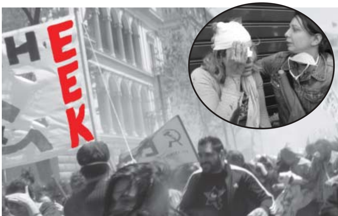
Διάβαζε σελ. 8 -9

Το Εργατικό Επαναστατικό Κόμμα, που επίσης δέχθηκε -γι' άλλη μια φορά- σημαντικό βάρος της επίθεσης, με ανακοίνωσή του καταγγέλλει την Κυβέρνηση Παπανδρέου και την Αστυνομία για την άγρια καταστολή της μαζικής απεργιακής διαδήλωσης της 11ης Μάη στην Αθήνα.