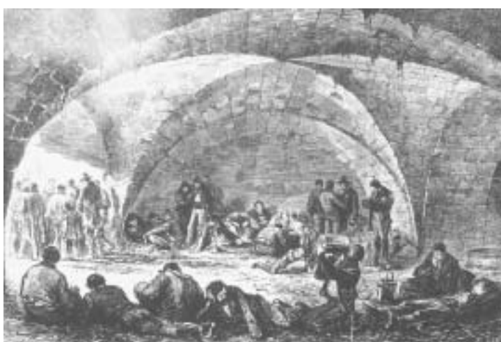
Κομμουνάροι αιχμάλωτοι στις Βερσαλλίες

Σε μία επανάσταση τα πιο καταπιεσμένα κομμάτια μιας κοινωνίας βγαίνουν μπροστά. Έτσι, οι γυναί-