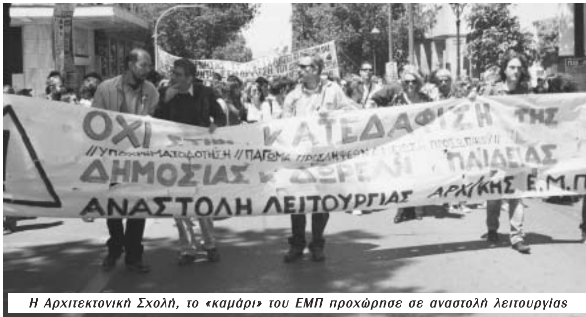
Η Αρχιτεκτονική Σχολή, το «καμάρι» του ΕΜΠ προχώρησε σε αναστολή λειτουργίας

Ελλάδος (νομοί Ηλείας, Αχαΐας, Απωλοακαρνανίας), Δυτικής Μακεδονίας (νομοί Γρεβενών, Καστοριάς, Κοζάνης, Φλώρινας) και το "Διεθνές Ελληνικό Πανεπιστήμιο" στη Θεσσαλονίκη.