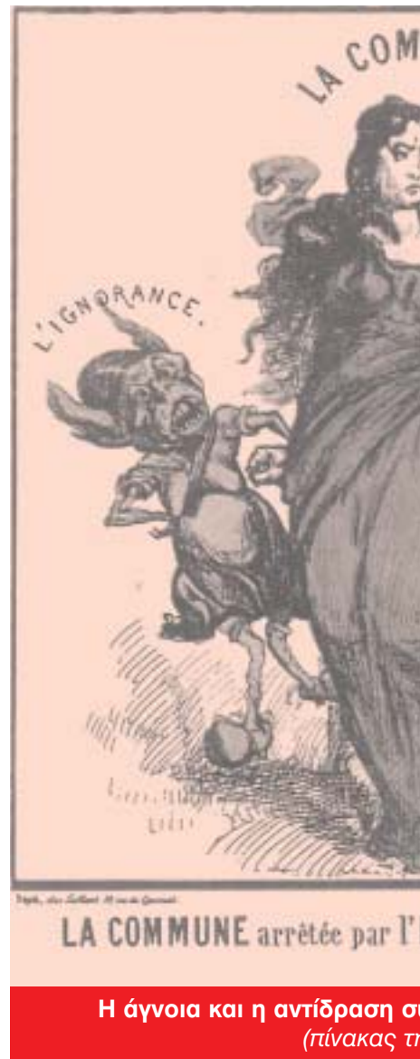
Η άγνοια και η αντίδραση στην Κομμούνα (πίνακας του...

Για να νικήσει η κοινωνική επανάσταση πρέπει να υπάρχουν τουλάχιστο δύο όροι: υψηλή ανάπτυξη των παραγωγικών δυνάμεων και κατάλληλη προετοιμασία του προλεταριάτου. Το 1871 όμως και οι δύο αυτοί όροι δεν υπήρχαν. Ο γαλλικός καπιταλισμός ήταν ακόμη αδύνατα αναπτυγμένος και η Γαλλία ήταν τότε χώρα κυρίως των μικροαστών (βιοτέχνες, αγρότες, μικροκαταστηματαρχές κ.ά.). Από την άλλη μεριά δεν υπήρχε εργατικό κόμμα, δεν υπήρχε προετοιμασία και μακρόχρονη εξα-