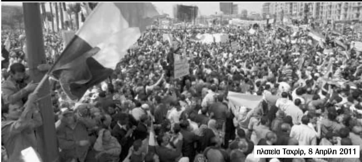
πλατεία Ταχρίρ, 8 Απρίλη 2011

νους αντιμέτωπους με τις επίλεκτες δυνάμεις του στρατού οι οποίες πραγματοποίησαν εκατοντάδες συλλήψεις και τραυματισμούς διαδηλωτών.