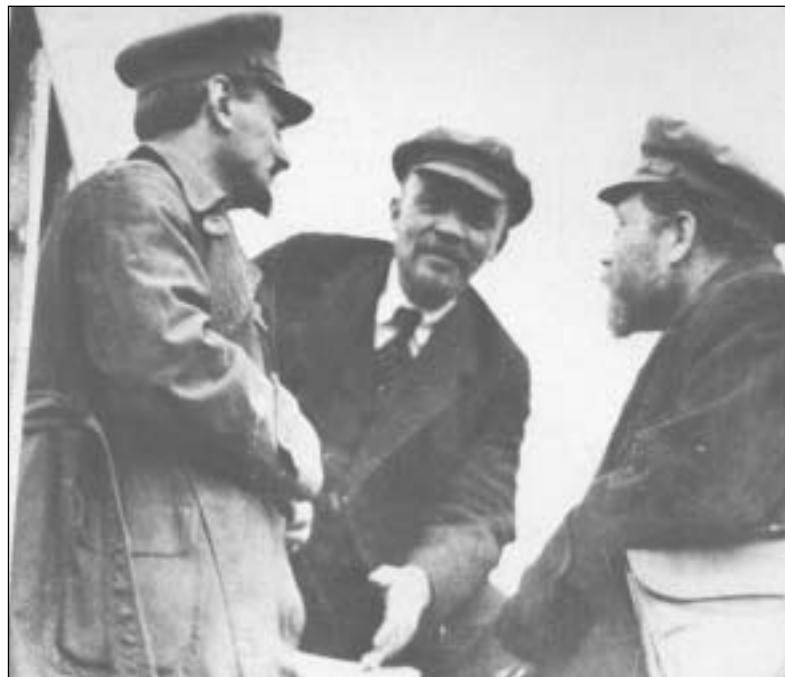
Λένιν, Τρότσκι, Κάμενεφ

αντιφάσεις όμως είναι κραυγαλέες. Η κυριότερη είναι το ταξίδι του Πιατάκοφ στο Όσλο, στη Νορβηγία, όπου από τον Ιούνιο του 1935 μέχρι τον Δεκέμβριο του 1936 είχε γίνει δεκτός ο εξόριστος Τρότσκι. Υποτίθεται, σύμφωνα με το κατηγορητήριο, ότι ο Πιατάκοφ, τον Δεκέμβριο του 1935 ταξίδεψε με αεροπλάνο από το Βερολίνο της χιλερικής Γερμανίας στο Όσλο της Νορβηγίας, για να συναντήσει τον Τρότσκι και να συνηγορήσει για τις αντιεπαναστατικές τους ενέργειες. Καθώς ο Τρότσκι στη Νορβηγία είχε ενημέρωση από τον τύπο για τη διαδικασία της 2ης Δίκης έστειλε τηλεγράφημα στο ανώτατο δικαστήριο της ΕΣΣΔ διαψεύδοντας τη συνάντηση. Προκαλούσε μάλιστα να ζητηθεί από τον Πιατάκοφ να περιγράψει πού έγινε συνάντηση μαζί του και πώς ήταν το σπίτι ή το διαμέρισμα όπου συναντήθηκαν. Στο μεσοδιάστημα της ακροαματικής διαδικασίας, στις 25 Γενάρη, μια μεγάλη συντηρητική εφημερίδα της Νορβηγίας δημοσίευσε έρευνα με βάση την οποία κανένα ξένο αεροπλάνο δεν είχε προσγειωθεί στο αεροδρόμιο του Όσλο τον Δεκέμβρη, όταν υποτίθεται, με βάση τις καταθέσεις, ο Πιατάκοφ ταξίδεψε από το Βερολίνο. Για να γίνει πειστικό το κατηγορητήριο, ο εισαγγελέας Βυσίνσκι σε μια επόμενη εξέταση του Πιατάκοφ, στις 27 Γενάρη 1937, τον ξαναρωτάει αν προσγειώθηκε με αεροπλάνο σε νορ-