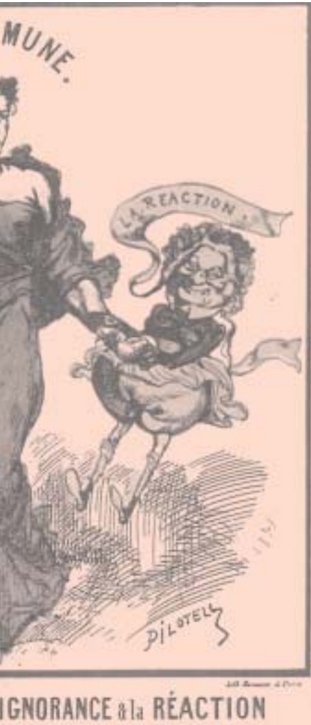
αλλαμβάνουν την Κομμούνα της εποχής)

κετά για να χαρακτηρίσουν το πραγματικό της νόημα και τους πραγματικούς της σκοπούς. Η Κομμούνα αντικατέστησε το μόνιμο στρατό, το τυφλό αυτό όργανο στα χέρια των κυρίαρχων τάξεων, με το γενικό εξοπλισμό του λαού, θέσπισε το χωρισμό της εκκλησίας από το κράτος, κατέργησε τον προϋπολογισμό των δρησκευμάτων (δηλ. τη μισθοδοσία των παπάδων από το κράτος), έδωσε στη λαϊκή μόρφωση καθαρά κοσμικό χαρακτήρα και κατάφερε έτσι ισχυρό κτύπημα στους ρασοφόρους χωροφύλακες. Στον καθαρά κοινωνικό τομέα λίγα πρόφτασε να κάνει, ωστόσο αυτά τα λίγα αποκαλύπτουν αρκετά καθαρά το χαρακτήρα της, ως λαϊκής, εργατικής κυβέρνησης: απαγόρευσε τη νυκτερινή δουλειά στα αρτοποιεία, κατέργησε το σύστημα των προστίμων, τη νομιμοποιημένη αυτή ληστεία των εργατών. Τέλος, έκδοσε το περίφημο διάταγμα, σύμφωνα με το οποίο όλες οι φάμπρικες, τα εργοστάσια και τα εργαστήρια, που εγκαταλείφθηκαν ή κλείστηκαν από τους ιδιοκτήτες τους παραδίνονταν στους ερ-