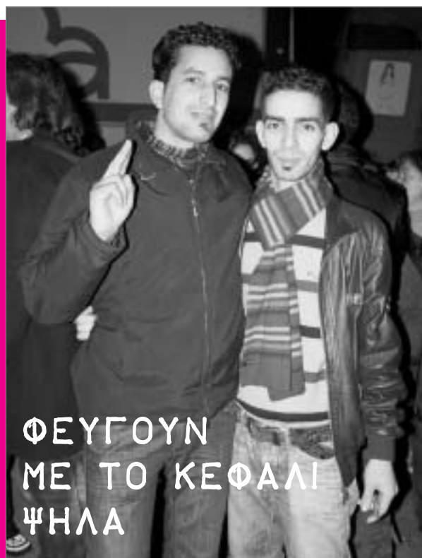
ΦΕΥΓΟΥΝ ΜΕ ΤΟ ΚΕΦΑΛΙ ΨΗΛΑ

νας και από την πολιτική ενίσχυση με συμμετοχή στις διαδηλώσεις αλληλεγγύης – όταν δεν έκανε διασπαστικές απόπειρες. Το ίδιο και οι επαγγελματίες του ρεφορμιστικού αντιρατσισμού, αλλά και πολλές απ' τις ομάδες της αναρχίας... Ούτε, μπορεί κανείς να κρύβεται πίσω από τις υπαρ-