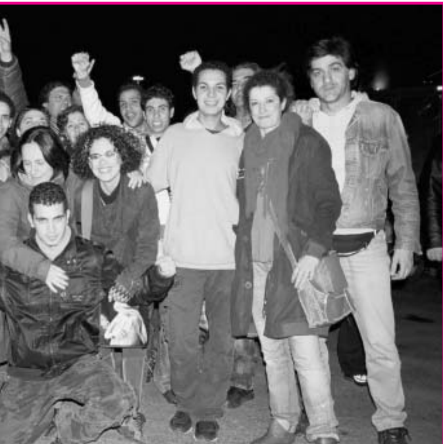
απεργούς, λίγο πριν αποπλεύσουν με το πλοίο για τα Χανιά

παραβίαση του ασύλου, ως την σημαντική στήριξη του αγώνα από μέλη του ΣΥΝ και ιδίως της νεολαίας του. Μιλάμε για το μεγαλύτερο μέρος της λεγόμενης εξωκοινοβουλευτικής, ριζοσπαστικής αριστεράς, που έλαμψε δια της απουσίας της και από την έμπρακτη ενίσχυση των απεργών πεί-