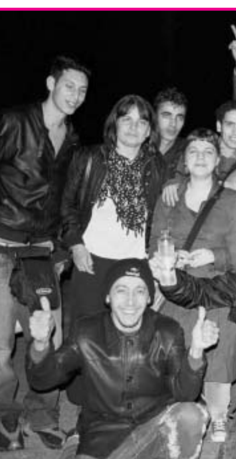
Οι απεργοί πείνας μαζί με αλληλέγγυους

Οι μετανάστες είναι της γης οι κολασμένοι. Δεν θαλασοπνίγονται για να κάνουν τουρισμό στην Ελλάδα και στην Ευρώπη. Είναι τα κύματα που προκαλεί το «τσουνάμι» της παγκόσμιας καπιταλιστικής κρίσης, της οικονομικής κρεοκοπίας και της καταστροφής της φύσης στις χώρες του Μαγκρέμπ, της Αφρικής και της Ασίας, των πολέμων και των δικτατοριών δυτικής –ιμπεριαλιστικής– έμπνευσης και στήριξης. Η μετανάστευ-