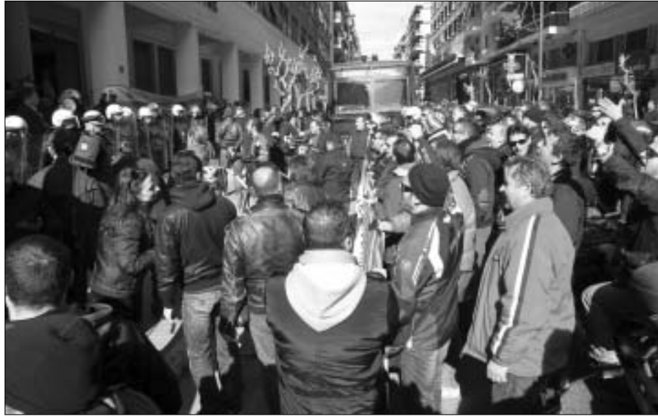
Οδηγοί της ΕΘΕΛ εκφράζουν την συμπαράστασή τους στους γιατρούς που έχουν καταλάβει το Υπ. Υγείας

ασφάλεια και η ποιότητα στις αστικές συγκοινωνίες υποβαθμίζονται σε επικίνδυνο βαθμό αυξάνεται η τιμή των εισιτηρίων κατά 40% πράγμα που έχει δημιουργήσει μια αυξανόμενη αγανάκτηση στο επιβατικό κοινό. Το συνεχώς ογκούμενο κίνημα του δεν πληρώνω που κατ'επανάληψη έχει δείξει την έμπρακτη συμπαράστασή του στους αγώνες των εργαζόμενων μπορεί να γίνει ένας στρατηγικός σύμμαχος. Από αυτήν την συμμαχία μπορούν να δημιουργηθούν κοινωνικά στηρίγματα των αγώνων που θα λειτουργήσουν σαν αντίβαρο στον κοινωνικό αυτοματισμό που προσπαθεί να ενεργοποιήσει η κυβέρνηση και στην οργανωμένη εκστρατεία συκοφάντησης από τα ΜΜΕ. Το αίτημα για ελεύθερες