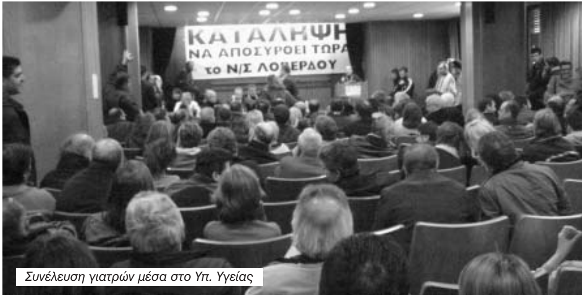
Συνέλευση γιατρών μέσα στο Υπ. Υγείας