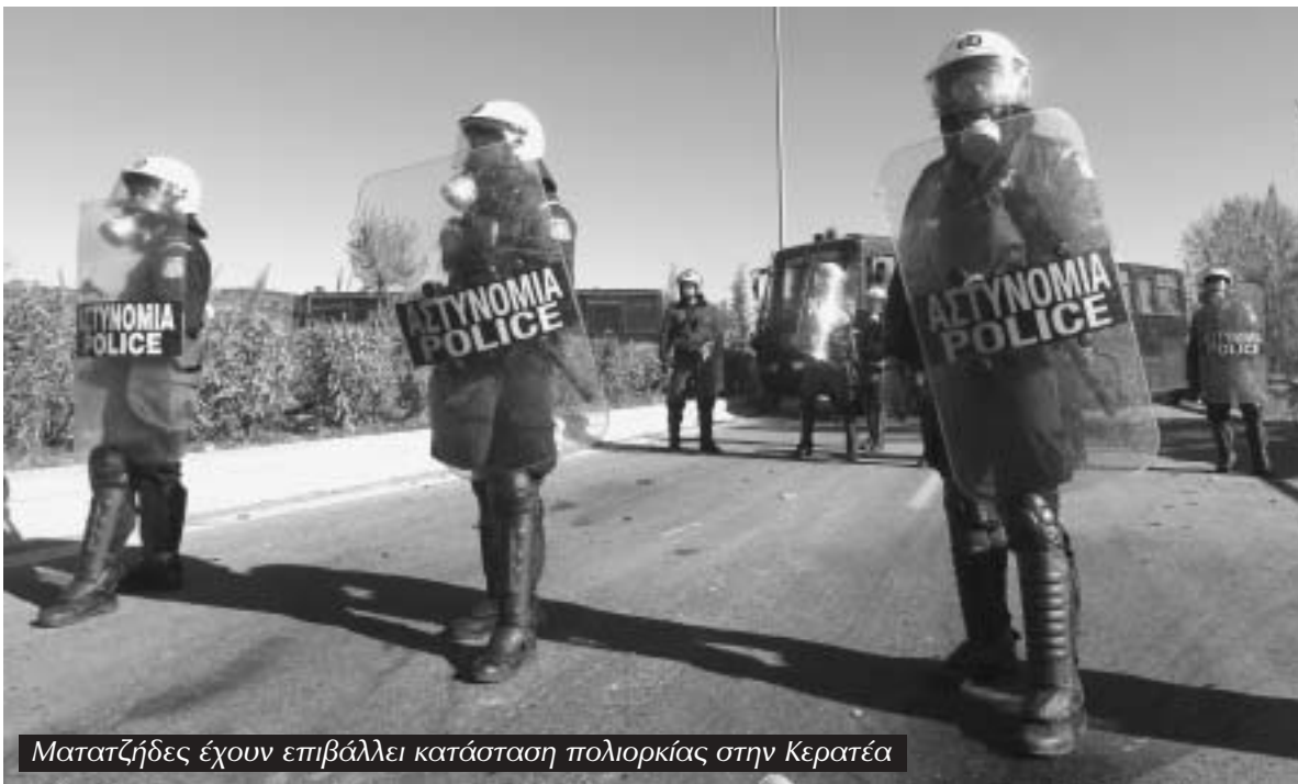
Ματατζήδες έχουν επιβάλλει κατάσταση πολιορκίας στην Κερατέα

...Τα παιδιά της Κερατέας, τα νέα παιδιά έχουν βγει μπροστά, κάνουν όλο τον αγώνα, χτυπούνται με τα ΜΑΤ κάθε βράδυ. Δεκαεπτά άτομα έχουν συλληφθεί με κατηγορίες κακουργηματικής πράξης όπως δολοφονία από πρόθεση κατά συρροή. Χτες συλλάβανε 2 παιδιά στα έξι χιλιόμετρα μακριά από τα μπλόκα της Κερατέας με το επείρημα ότι η λάσπη που είχαν τα παπούτσια τους έμοιαζε με τη λάσπη που υπάρχει στην περιοχή!! Κάποτε λέγαμε ότι τα παιδιά αυτά με τις πράσινες στολές είναι παιδιά δικά μας... είναι παιδιά του λαού. Έχουμε αλλάξει. Δεν είναι παιδιά δικά μας, δεν είναι καθόλου παιδιά, είναι γουρούνια! Όταν ένας άνθρωπος ηλικιωμένος πέφτει κάτω γιατί τον χτύπησαν και πέφτουν άλλα 6 γουρούνια από πάνω να τον κλωτσάνε, να τον πατάνε και να τον βαράνε δεν είναι από εντολές. Το έχουν έμφυτο. Όταν σκάνουν αυτό το όπλο που πετάει κημικά στα 200 μέτρα που ρίχνει με δύναμη και το σκάνουν και χτυ-