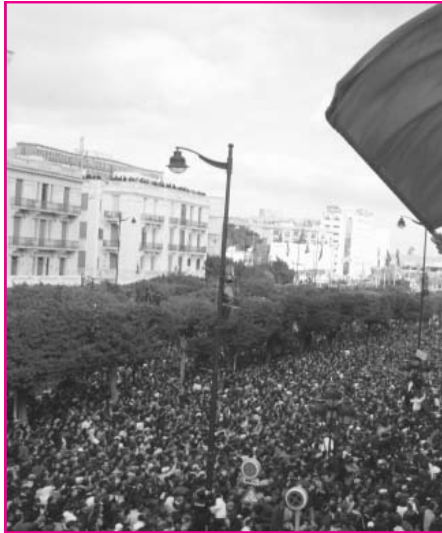
Μαζική Διαδήλωση στην Τύνιδα στις 15 Ιανουαρίου 2011 ενάντια στον πρόεδρο (σ' αυτή που προεδρεύει ο "δικός μας" Giorgos) είχε ανακοινώσει ο έσκασε με κατεύθυνση τη Γαλλία, που για χρόνια τον στήριζε, αλλά με

3. Η αντίδραση του ιμπεριαλισμού στην Τυνησιακή επανάσταση έχει γίνει ένα κατεξοχήν παράδειγμα υποκρισίας. Με δεδομένες τις μεγαλοστομίες επάνω στη σημασία της δημοκρατίας ενάντια σε έθνη που θεωρούν εχθρούς, οι ΗΠΑ και η ΕΕ έχουν μια τελείως διαφορετική προσέγγιση απέναντι στην Τυνησία. Η ΕΕ και ιδιαίτερα η Γαλλία, πρώην αποικιακή δύναμη στην Τυνησία,