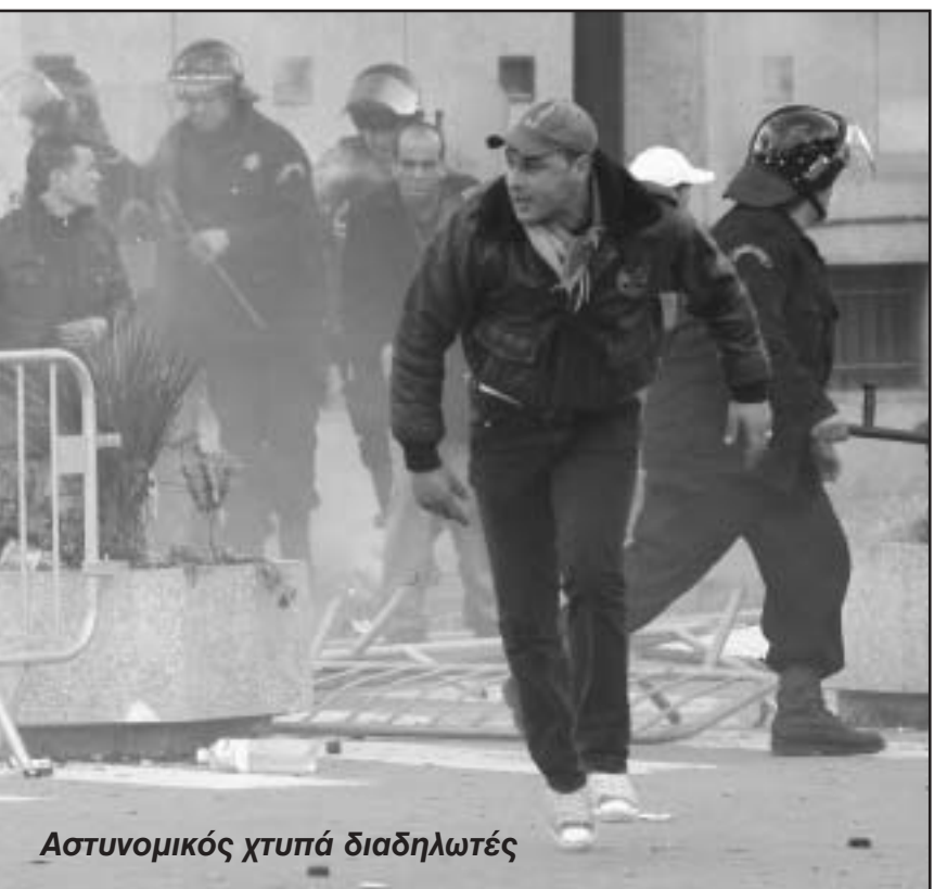
Αστυνομικός χτυπά διαδηλωτές

Η Πρωτοβουλία για ένα Επαναστατικό Εργατικό Κόμμα (DIP) - Τουρκία 16 Ιανουαρίου 2011