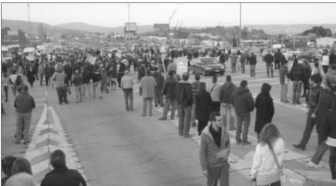
Χιλιάδες πολίτες καταλαμβάνουν τα καταστρώματα των εθνικών οδών

Εκατοντάδες χιλιάδες οδηγοί πέρασαν χωρίς να πληρώσουν το