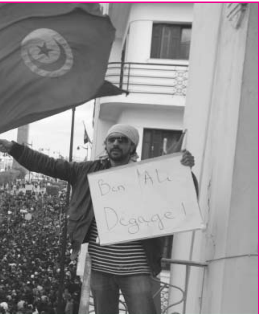
Πρόεδρος Μπεν Αλί. Λίγο πριν, ο επί 23 χρόνια πρόεδρος και μέλος της Β' Διεθνούς δεν θα θέσει καινούργια υποψηφιότητα ως πρόεδρος. Λίγο αργότερα το κατόπι της άρνησής του Σαρκοζί να τον δεχθεί πήγε στη Σαουδική Αραβία.

παλιό καθεστώς. Ο Ομπάμα, ήρωας για πολλούς, ήρθε τελικά να "χειροκροτήσει" τον Τυνησιακό λαό, αλλά μονάχα μετά την ανατροπή του Μπεν Αλί! Έχοντας