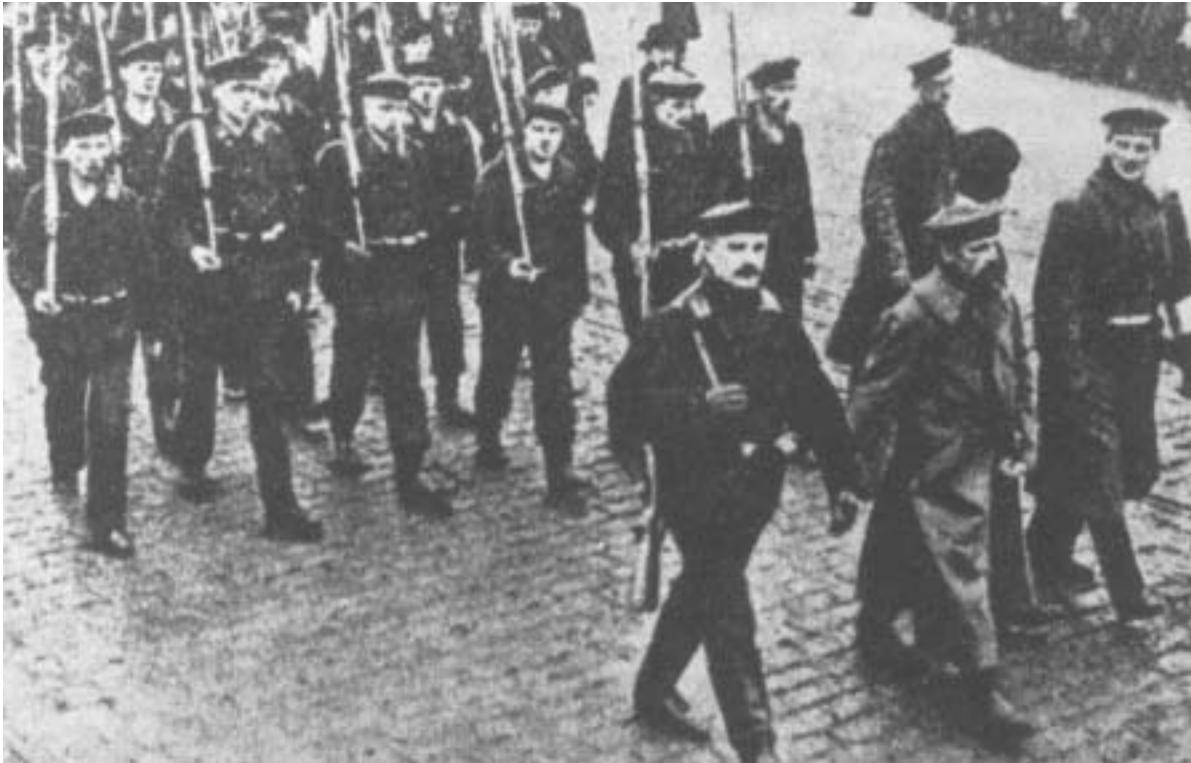
Επαναστατημένοι στρατιώτες στο Κίελο

επαναστατικές κεφαλές και επαναστατικές γλώσσες δεν είναι ικανές ή δε θεωρούν καλό να βάλουν σε κίνηση, μόλις χρειαστεί, τις επαναστατικές γροθιές - τότε και ο ίδιος ο κοινοβουλευτισμός και όλη η περιφέρη νομιμότητα θα εξαφανισθούν, αργά ή γρήγορα, ως βάση του πολιτικού αγώνα. Ύστερα, η νομιμότητα αποδεικνύεται ότι είναι προϊόν του συσχετισμού των δυνάμεων των διαφόρων τάξεων που συγκρούονται, και ότι πάντα ταλαντεύεται. Η Βαυαρία, η Σαξονία, το Βέλγιο και η Γερμανία μας δίνουν αρκετά πρόσφατα παραδείγματα που αποδεικνύουν ότι οι κοινοβουλευτικές συνθήκες της πολιτικής πάλης παραχωρούνται ή αφαιρούνται από την κυρίαρχη τάξη, διατηρούνται ή αίρονται, ανάλογα με το βαθμό που οι θεσμοί αυτοί διασφαλίζουν τα ταξικά της συμφέροντα, ανάλογα με την επίδραση που ασκεί η υπόκωφη βία των λαϊκών μαζών, επιθετική ή αμυντική. Και πραγματικά, όπως σε ορισμένες εξαιρετικές περιπτώσεις δεν είναι δυνατό να αποφύγουμε τη βία σε μέσο άμυνας των κοινοβουλευτικών δικαιωμάτων, έτσι επίσης σε ορισμένες άλλες περιπτώσεις, η βία είναι μέσο επίθεσης αναντικατάστατο, εκεί όπου ακόμη πρόκειται να κατακτήσουμε το νόμιμο