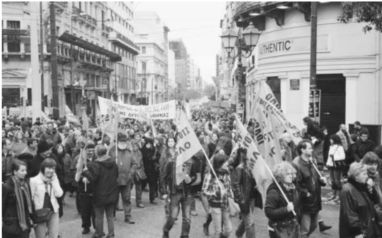
Όλη η Πατησίων, μέχρι το πεδίο του Άρεως (αριστερά)

στους μισθούς των 8.000 ευρώ, αλλά παίρνουν το επίδομα παρουσίας(!) στις επιτροπές της Βουλής. Φαντα- στείτε και τους εργάτες εκτός από τους μισθούς να διεκδικούν και επί- δομα... παρουσίας!]. Οι εργάτες ρί- χνονται στην ανεργία (και η ευκολία να απολύονται χωρίς αποζημίω- ση αναγορεύεται σε μέτρο κατά της ανεργίας από την κυβέρνηση), και οι επαγγελματίες πνίγονται από την έλλειψη αγοραστικής δύναμης και την πιστωτική ασφυξία που επιβάλ- λουν οι τράπεζες.