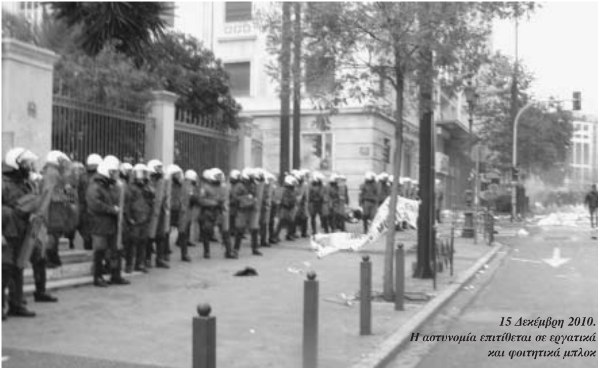
15 Δεκέμβρη 2010. Η αστυνομία επιτίθεται σε εργατικά και φοιτητικά μπλοκ

Η αδυναμία αποπληρωμής ακόμη και των πάγιων υποχρεώσεων των ιδρυμάτων, ιδιαίτερα των ΤΕΙ της περιφέρειας, καθιστά σαφή την