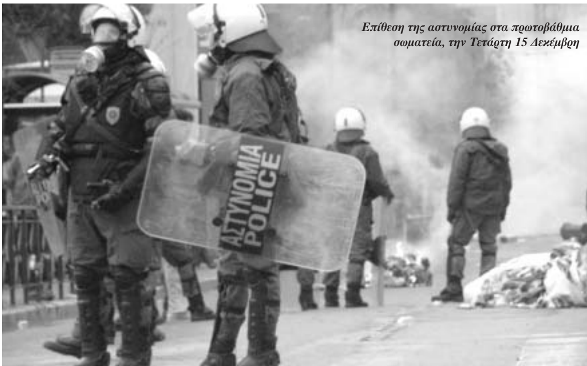
Επίθεση της αστυνομίας στα πρωτοβάθμια σωματεία, την Τετάρτη 15 Δεκέμβρη