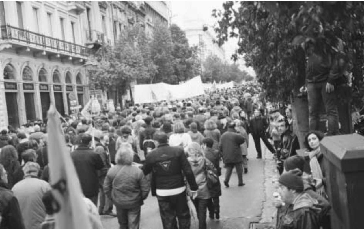
... και όλη η Σταδίου (δεξιά), πλημμύρισαν από διαδηλωτές

πειθούς με τον κρατικό καταναγκασμό και βία. Η κυβέρνηση Παπανδρέου, επιτιθέμενη στα εργατικά-λαϊκά στρώματα και σε όλη την κοινωνική βάση του παλαιού ΠΑΣΟΚ,