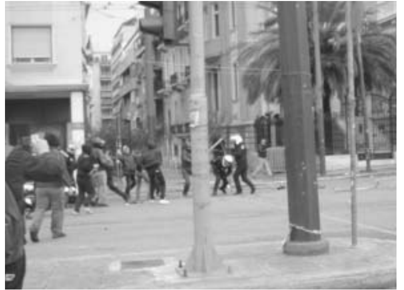
Η αστυνομία προστατεύει τους συνεργάτες της τρόικας