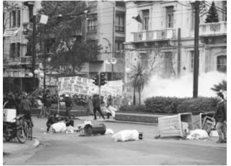
Έξω από τη ΓΣΕΕ