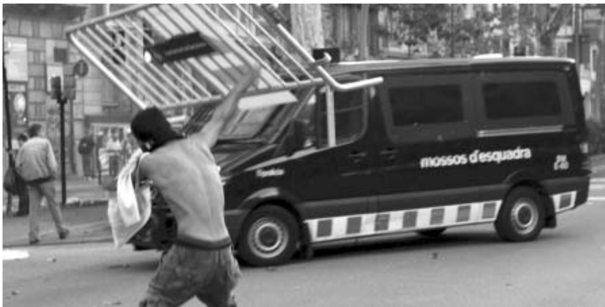
Διαδηλωτής στην Καταλονία

Είναι κοινό μυστικό στο Βερολίνο ότι το επιτελείο της Μέρκελ και τα "think tank" που