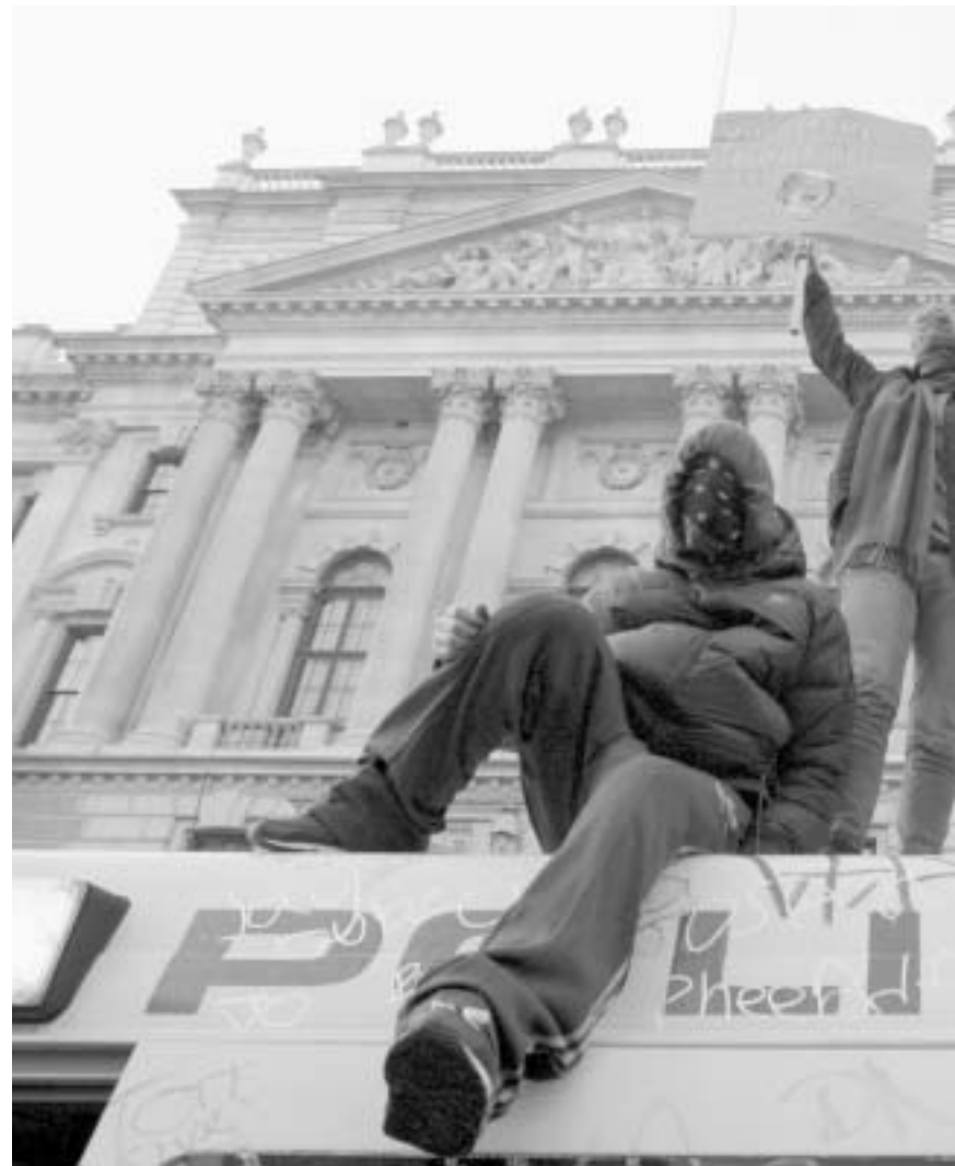
Διαμαρτυρία φοιτητών στο Λονδίνο

Η πιο εκρηκτική αντίφαση της παρούσας διεθνούς οικονομικής κατάστασης είναι ότι από τη μια, το σύνολο των καπιταλιστικών χωρών εξαρτάται από τη ζήτηση που έχουν οι ΗΠΑ, κι από την άλλη, τα αμερικανικά σχέδια αύξησης της νομισματικής ρευστότητας και «χρηματοπιστωτικής τόνωσης» είναι, αναμφίβολα η πολιτική κήρυξης του λεγόμενου πολέμου των νομισμάτων και απειλή κατάρρευσης των κυριότερων ανταγωνιστών των ΗΠΑ. Έχει απορριφθεί η δυνατότητα μιας διεθνούς συμφωνίας για μια νομισματική «εξισορρόπηση» ανάμεσα στις κυριότερες χώρες. Μια χρεοκοπία παρόμοιων διαστάσεων δεν ρυθμίζεται με συζητήσεις. Ακόμα και οποιαδήποτε συμφωνία να γίνει, θα είναι πλασματική και επισφαλής, και θα προετοιμάζει νέα σοκ,