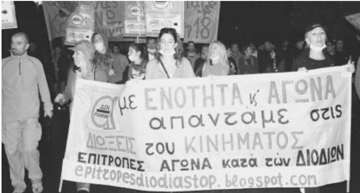
Το Μπλοκ των Επιτροπών Ενάντια στα Διόδια, στη διαδήλωση του Πολυτεχνείου, όπου δέχθηκαν επίθεση των ΜΑΤ

Τα διόδια στην πραγματικότητα είναι ένας Κεφαλκός Φόρος που τον πληρώνουμε κατευθείαν στις τράπεζες και στις εταιρείες. Νέοι φόροι, περικοπές μισθών και συντάξεων, κατάργηση ασφαλιστικών δικαιωμάτων κλείσιμο επιχειρήσεων και μαζική ΑΝΕΡΓΙΑ είναι αυτά που απαιτούν το διεθνές και ντόπιο κεφα-