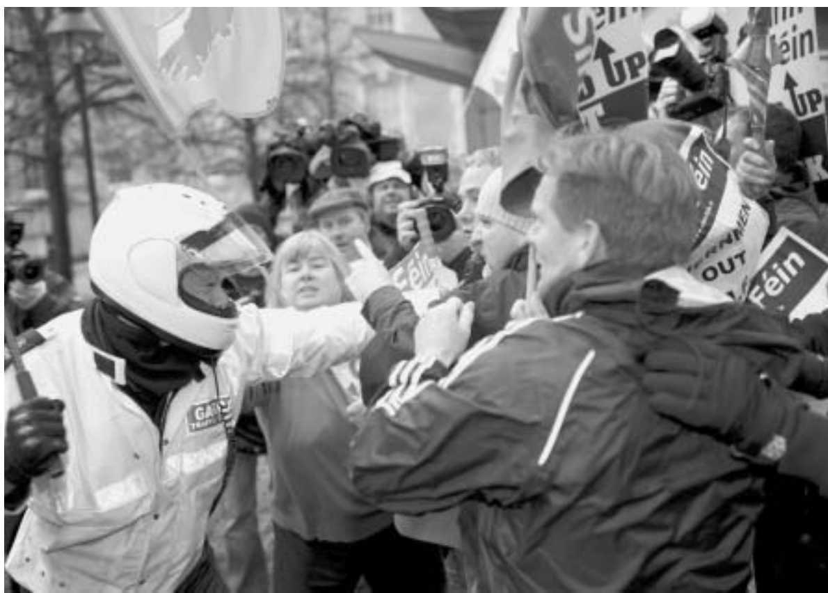
Η Ιρλανδική αστυνομία συγκρούεται με διαδηλωτές στο Δουβλίνο

Αλυσιδωτή έκρηξη κοινωνικών αγώνων της ευρωπαϊκής εργατικής τάξης και της νεοδημοκρατικής προκλήουν τα μέτρα της καπιταλιστικής χρεοκοπίας. Η κρίση όχι μόνο πυροδοτεί την ταξική πάλη, αλλά επίσης ενοποιεί τους αγώνες.