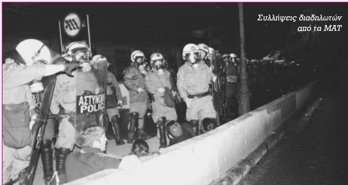
Συλλήψεις διαδηλωτών από τα ΜΑΤ

Στις 17 του μήνα, ημέρα της μεγάλης διαδήλωσης προς την αμερικανική πρεσβεία –τον πραγματικό ενορχηστρωτή του απριλιανού στρατιωτικού πραξικοπήματος- δεκάδες χιλιάδες (η αστυνομία μίλησε για 30.000, άλλοι μιλούν για 50.000 έως 100.000) λαού διαδήλωσαν παρά την καταρακτώδη βροχή. [Η μεγάλη μαζικότητα της διαδήλωσης έρχεται αμέσως μετά τις δημοτικές και περιφερειακές εκλογές όπου η κυβέρνηση ΠΑΣΟΚ και τα αστικά κόμματα καταβαραθρώθηκαν, ενώ φάνηκε όλη η γύμνια και απονομιμοποίηση του αστικού πο-