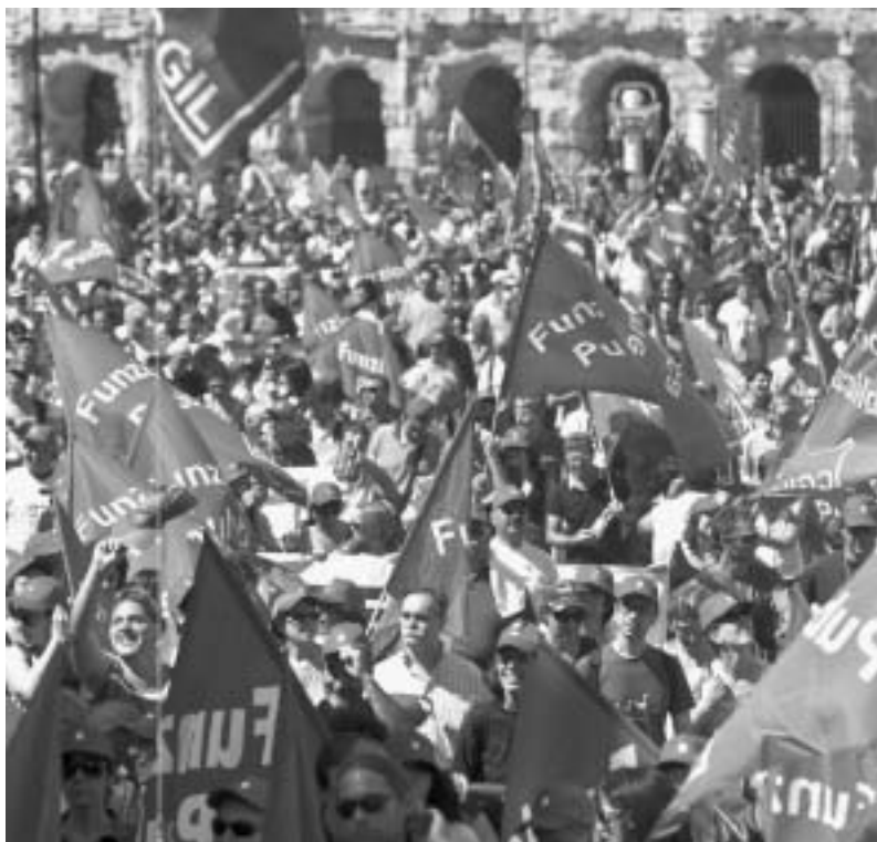
Διαδήλωση στην Ιταλία