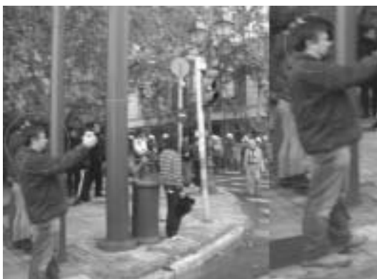
τον... όπου και... μπήκε σε διαδικασία άτακτης φυγής...

Το κινηματογραφικό της ασφάλειας σε διατεταγμένη υπηρεσία... Παλιές γνωστές τακτικές αλλά όχι με μπατσόπουλα και ασφαλιτάκια της σειράς αλλά από καλά «ειδικούς» ... της... κρατικής ασφάλειας και της αντιτρομοκρατικής. Ο εικονιζόμενος «διαδηλωτής» (με μικρή βιντεοκάμερα σπαστή) κινηματογραφεί από την αρχή της πορείας το μπλοκ του ΕΕΚ, τις αλυσίδες και όλους όσους βρίσκονται στην εμβέλεια της κάμερας και όσοι επιλέγονται κοντά στο μπλοκ. Βρίσκεται πάντα επί του πεζοδρομίου και πίσω από τα διαχωριστικά κηκλιδώματα, κοντά σε διμυρίες ΜΑΤ και λοιπων συγγενων του, αλλά συνεχίζει να ακολουθεί την πορεία (και το συγκεκριμένο μπλοκ) κατά μήκος της Βασ. Σοφίας μέχρι και πριν από το Χίλ-