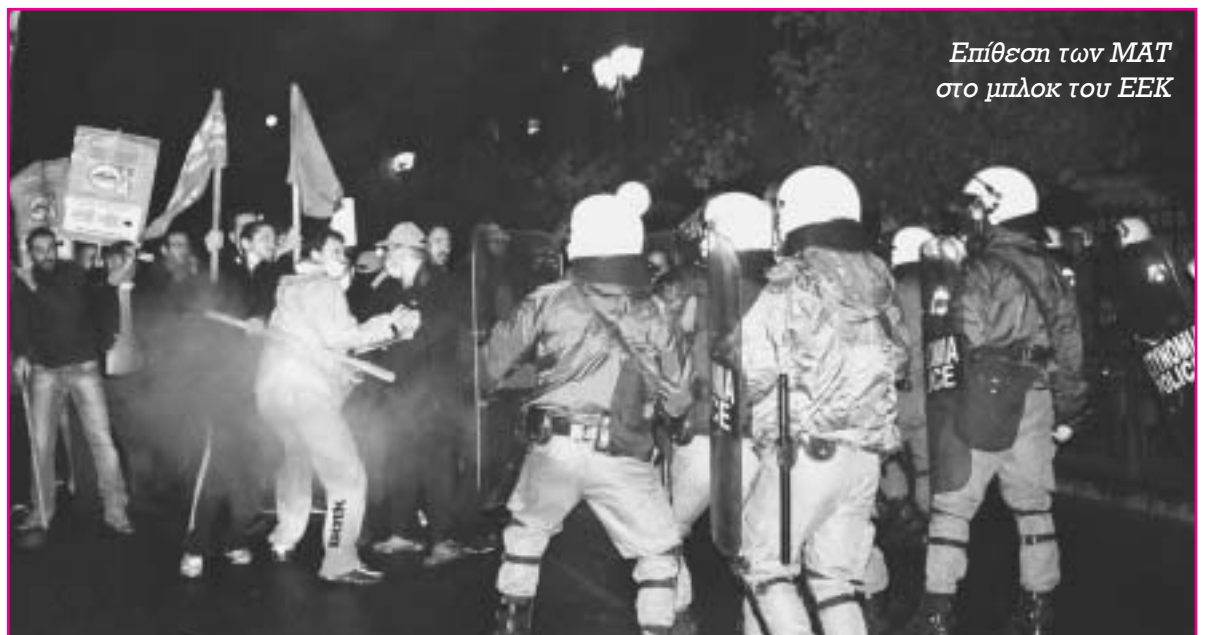
Επίθεση των ΜΑΤ στο μπλοκ του ΕΕΚ

Η αστυνομία εξ αρχής εφαρμόσε μια επιθετική τακτική κατά της διαδήλωσης. Πριν καν ξεκινήσει η πορεία, σε διάφορα σημεία της Αθήνας και των συνοικιών πραγματοποιούνταν έλεγχοι και προληπτικές προσαγωγές. Ανάμεσα σ' αυτούς που πάστηκαν και μεταφέρθηκαν στη ΓΑΔΑ χωρίς καμιά προφανή αιτία ήταν