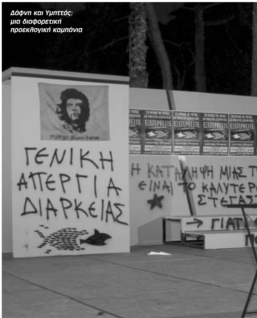
Δάφνη και Γυπτός: μια διαφορετική προσεκλογική καμπάνια

Αντίστοιχα, ένα μέρος της λαϊκής διαμαρτυρίας εκφράστηκε με την υπερψηφίση ψηφοδελητίων, κυρίως του ΚΚΕ, που είδε τις δυνάμεις του από 7,5% το 2009 να φθάνουν στο 11-12% σε πανελλαδική κλίμακα, αυξάνοντας τα ποσοστά του σχεδόν κατά 50% και τον αριθμό των ψή-