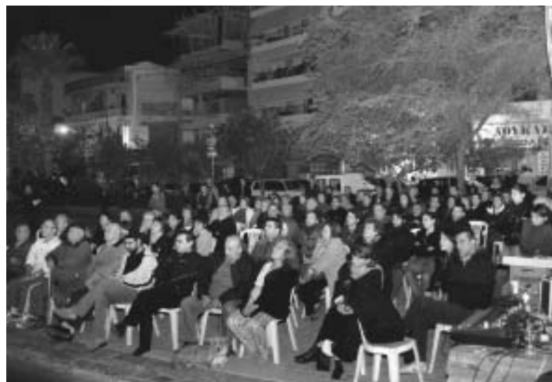
Προεκλογική συγκέντρωση της ΜΑΡΙΔΑ στη Δάφνη