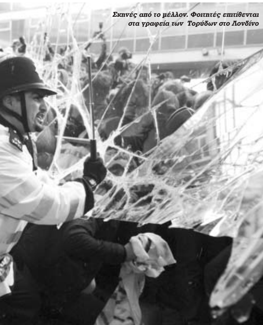
Σκηνές από το μέλλον. Φοιτητές επιτίθενται στα γραφεία των Τορύδων στο Λονδίνο