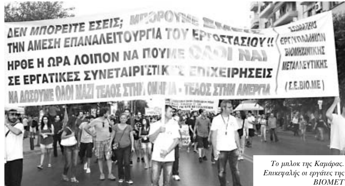
Το μπλοκ της Καμάρας. Επικεφαλής οι εργάτες της ΒΙΟΜΕΤ

Κατά γενική ομολογία, η μαζικότερη συγκέντρωση (8 - 10 χιλιάδες) ήταν αυτή της ΓΣΕΕ-ΑΔΕΔΥ στο άγαλμα Βενιζέλου. Αφού απέδειξε την πίστη του στο κράτος, με την παρουσία βουλευτών του στις κινητοποιήσεις των αστυνομικών, ο ΣΥΡΙΖΑ απέδειξε και την πίστη του στην συνδικαλιστική γραφειοκρατία των Παναγόπουλων, ενισχύοντας αποφασιστικά τη συγκέντρωσή τους με τη μαζική δυναμική του. Παρούσα και η μισή ΑΝΤΑΡΣΥΑ, δηλαδή το ΣΕΚ, επιμένον στη συμπόρευση με τους εργατοπατέρες, αλλά και οι Αρανο-Αρασίτες. Πιο απροκάλυπτα από ποτέ, η ΓΣΕΕ