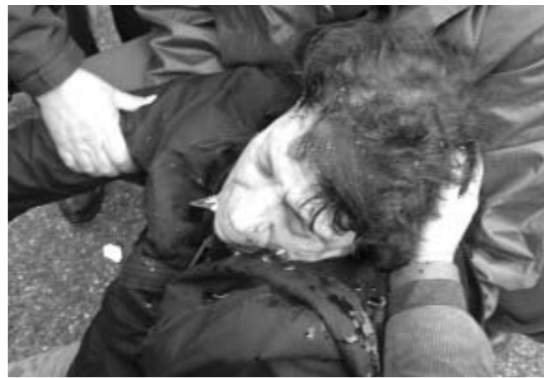
παθούσα προέβη σε μήνυση κατά παντός υπευθύνου, των φυσικών αυτουργών αστυνομικών και κα-

τά των ανωτέρων τους που έδωσαν την διαταγή να πέσουν με μοτοσυκλέτες κατά του πλήθους