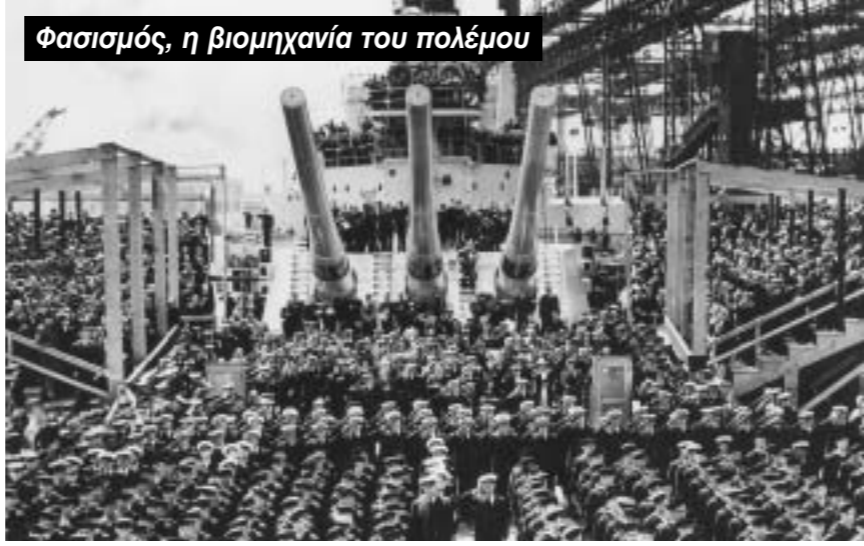
Φασισμός, η βιομηχανία του πολέμου

την εθνική οργάνωση της εργασίας». Το «Μέτωπο» διαιδρέθηκε σε 22 ομάδες. Τα συνδικάτα έπρεπε να γίνουν τα εργαλεία της κοινωνικής πολιτικής του καθεστώτος. Οι χώροι εργασίας έπρεπε να εκλέγουν «αντιπροσώπους» από μια λίστα, την οποία υπέβαλλε ο διευθυντής. Οι απεργίες απαγορεύονταν: τα «εργατικά δικαστήρια» άρχισαν να επιβάλλουν κυρώσεις και εισήγαγαν την «Εργατική Θητεία» για ένα χρόνο και για τα δυο φύλα. Ο ελεύθερος χρόνος επίσης οργανωνόταν από την KDF («Δύναμη μέσω της Χαράς»...) 2 Ο Hjalmar Schacht, ο άνθρωπος του μεγάλου κεφαλαίου, διορίστηκε πάλι υπουργός οικονομίας (1934-37): μια δεκαετία πριν είχε την οικονομική ευθύνη της Δημοκρατίας (της Βαϊμάρης) και στη συνέχεια έγινε υπουργός άνευ χαρτοφυλακίου ως το 1943. Υποστήριξε την επανεκκίνηση της παραγωγής με το μπλοκάρισμα του ξένου κεφαλαίου, «την υποκατάσταση των εισαγωγών» και μια βραχυβία πιστωτική πολιτική. Επίσης υποστήριξε την πολιτική δημοσίων έργων μεγάλης κλίμακας, που απορρόφησαν έναν τεράστιο αριθμό ανέργων. Οι μισθοί όμως είχαν πάλι μπλοκαριστεί. Η συγκεντρωτική οργάνωση των κεφαλαίων εννοούσε την μαζική εννοιοκρατία, με το Κράτος να αναλαμβάνει τους μη κερδοφόρους βασικούς τομείς, ειδικά της βιομηχανίας όπλων: ασότα, μετάλλο ( Hermann Goering Werke ). Υπήρχε επίσης μαζική έξοδος προς την ύπαιθρο χάρη σε κίνητρα για αγροτική παραγωγή καθώς και επαναφορά των μισθών στα στρατόπεδα, μισθοί σε είδος, καθώς και προσφορά εργατικής δύναμης (Εργατική Θητεία).