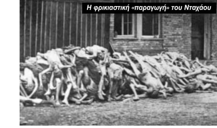
Η φρικιαστική «παραγωγή» του Νταχάου

Οι σύγχρονοι του Τρότσκι εκτίμησαν την ανάλυσή του για την άνοδο του Ναζισμού για την εκπληκτική διαύγεια της και την διέδωσαν σε ευρεία κλίμακα 3 αλλά λίγο συνειδητοποιούν ότι αυτή η ανάλυση αποτελεί μέρος ενός γενικότερου θεωρητικού σώματος για την ιστορική εποχή στην οποία αναφερόμαστε, την «εποχή της διαρκούς επανάστασης». Κάθε θεωρία της επανάστασης είναι επίσης μια θεωρία της αντεπανάστασης. Ο Τρότσκι περιέγραψε απλώς τις συνέπειες, για την ανθρώπινη κοινωνία και τον πολιτισμό, του νέου ιμπεριαλιστικού σταδίου του καπιταλισμού, όπως ορίστηκε από τον Λένιν το 1916, όταν ο Πρώτος Παγκόσμιος Πόλεμος ήταν στο απόγειό του, ως μια «εποχή πολέμων και επαναστάσεων», μια «εποχή αντίδρασης σ' όλη της την έκταση». Η σύνθεση του Τρότσκι είχε ως εξής: «...ο πόλεμος [ξέσπασε] μαζί με μια σειρά από σπασμούς, κρίσεις, καταστροφές, επιδημίες και θηριωδίες. Η οικονομική ζωή